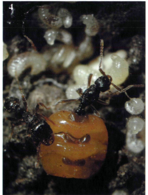
Abb. 2: Leptothorax clypeatus