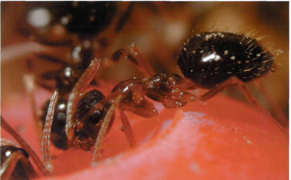
Abb. 1: Prenolepis nitens

Monomorium monomorium und Tetramorium bicarinatum konnten mithilfe von Typenmaterial aus dem Naturhistorischen Museum in Wien bestimmt werden, im Falle von T. bicarinatum anhand der Typen des jüngeren Synonyms T. kollari (MAYR, 1853). Technomyrmex albipes wurde nach Vergleichsstücken aus dem Sammlungsbestand des Naturhistorischen Museums Wien bestimmt. Folgende Fundmeldungen (alle vid. B. Seifert) wurden aus der Literatur übernommen: Proceratium melinum aus ÖGA (1995), Epimyrma stumperi (MÜLLER & al. 2002), Lasius sabularum und Formica selysi aus GLASER (2001), Formica foreli aus SEIFERT (2000) und Formica pressilabris (pers. Mitt. F. Glaser; GLASER & MÜLLER in prep.). Taxonomie und Nomenklatur entsprechen dem Stand Oktober 2002 (BOLTON 1995; SEIFERT 1996, 1997, 2000, 2001; ORLEDGE 1998; RADCHENKO 2000).